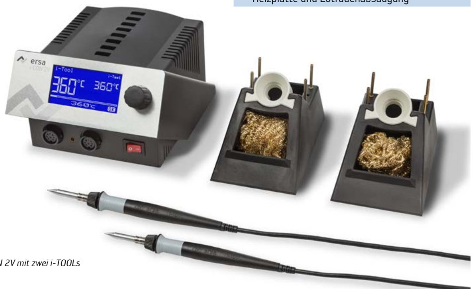
i-CON 2V mit zwei i-TOOLS