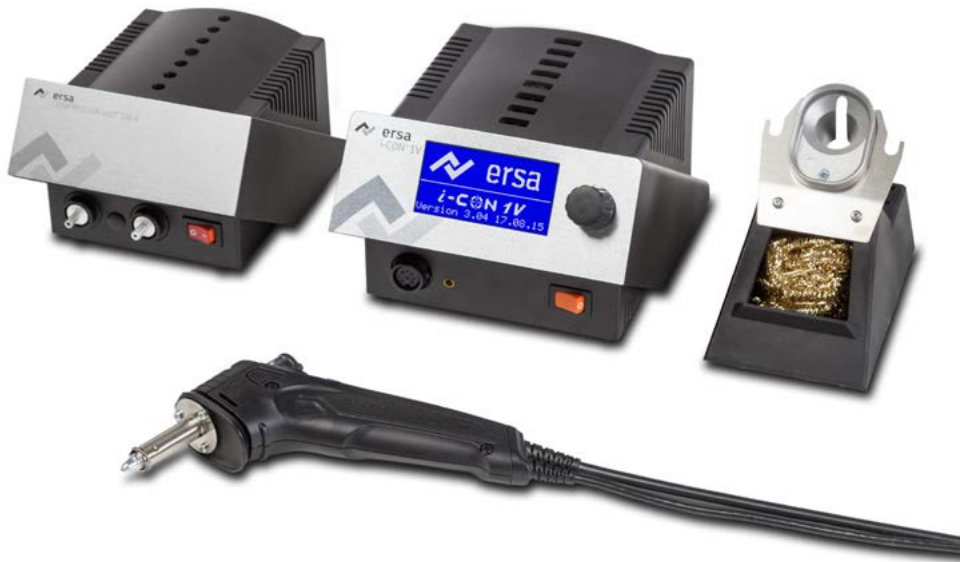
i-CON 1V mit X-TOOL VARIO und Vakuumeinheit

Nur wenn es eine i-CON ist, ist es eine i-CON!