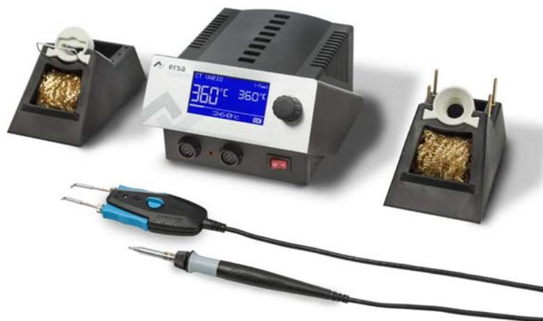
i-CON 2V mit i-TOOL und CHIP TOOL VARIO